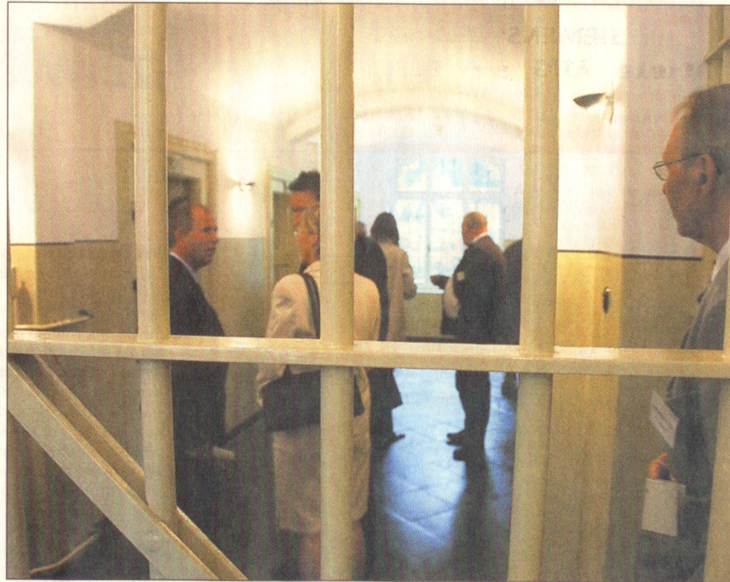
„Hinter Gittern“ – das erlebten am Freitag auch die Teilnehmer der Einweihungsfeier für das Otterndorfer „Alkatrass“.

Untergebracht sind die Manager während ihres Gefängnisaufenthaltes in den kargen Zellen. Die eigentliche Schulung findet aber in dem neu